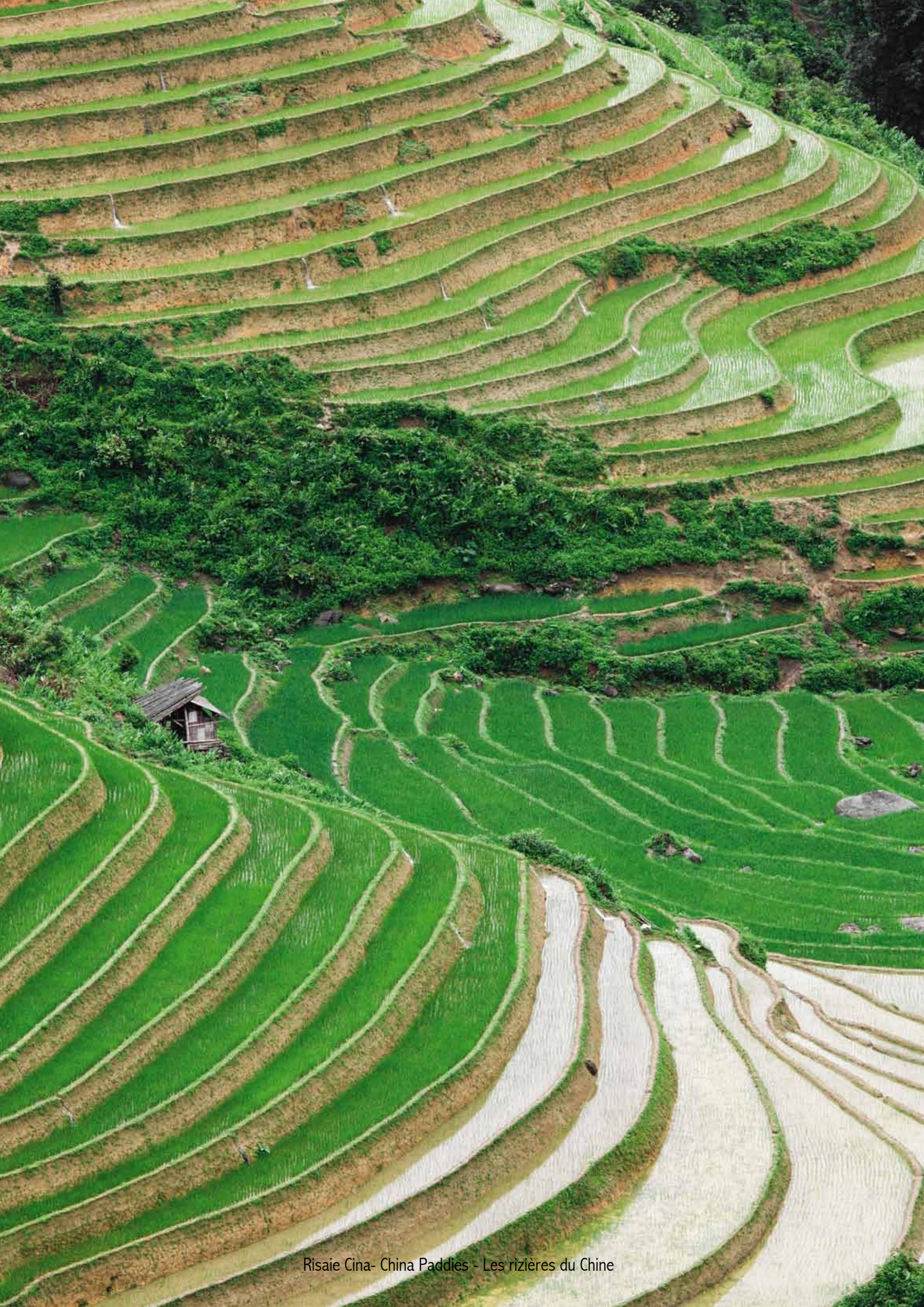
Risaie Cina- China Paddles - Les rizières du Chine