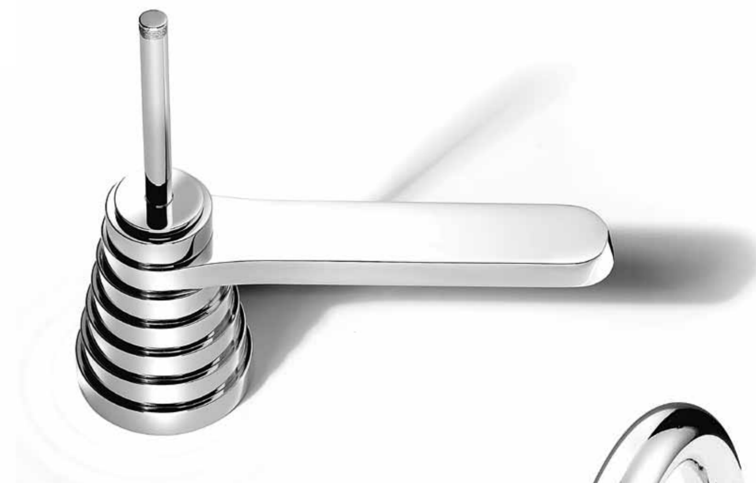
TITIAN 3222MC Gruppo monocomando lavabo bocca bassa Single-lever washbasin mixer Mitigeur monocommande pour lavabo

La serie Titian deve il suo nome alla pronuncia cinese dell'ideogramma che identifica le terrazze coltivate dell'Asia. The name "Titian" refers to the pronunciation of the Chinese ideogram that identifies the cultivated terraces in Asia. Conçue par Michele De Lucchi, cette série est inspirée par les champs en terrasse de l'Asie du Sud-Est, appelés "titian" en chinois.