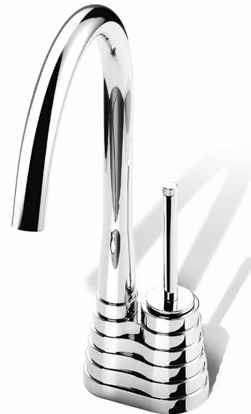
TITIAN 3223MC Gruppo miscelatore per lavabo, bocca alta orientabile a sezione tonda One-handle washbasin mixer, high round spout Mitigeur monocommande avec bec haut orientable

De Lucchi dit: "Titian est surtout une sculpture qui rappelle les pyramides, et certaines formes de la culture précolombienne avec ses jardins suspendus [...]. Paradoxalement c'est une pièce très architecturale parce que c'est une vraie construction où chaque anneau conserve étrangement sa propre pureté et sa propre cohérence, dans tous les produits de la série."