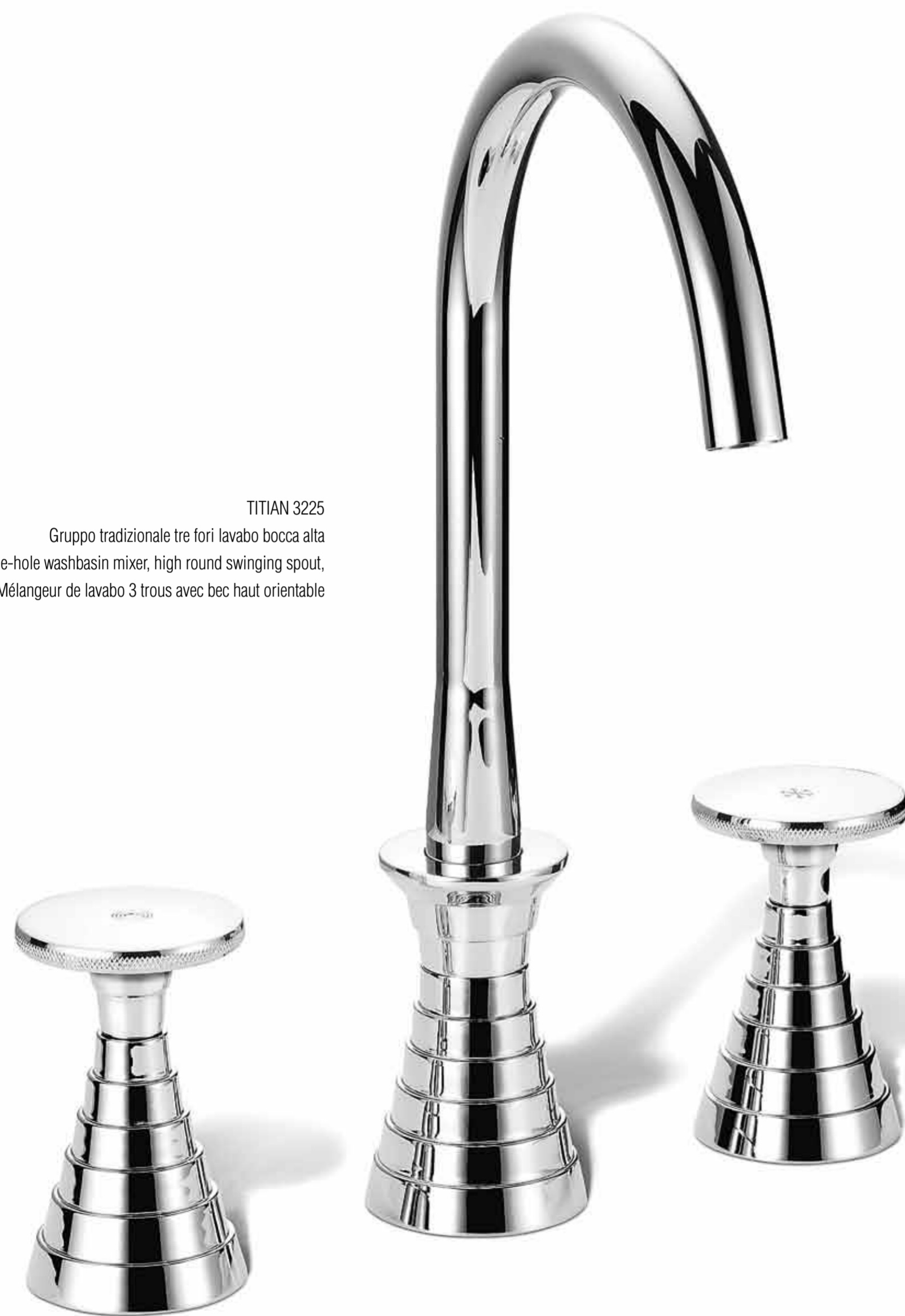
TITIAN 3225 Gruppo tradizionale tre fori lavabo bocca alta Three-hole washbasin mixer, high round swinging spout, Mélangeur de lavabo 3 trous avec bec haut orientable

La serie Titian deve il suo nome alla pronuncia cinese dell'ideogramma che identifica le terrazze coltivate dell'Asia. The name "Titian" refers to the pronunciation of the Chinese ideogram that identifies the cultivated terraces in Asia. Conçue par Michele De Lucchi, cette série est inspirée par les champs en terrasse de l'Asie du Sud-Est, appelés "titian" en chinois.